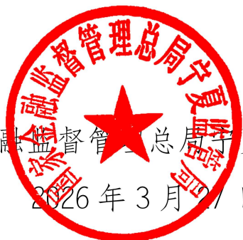
国家金融监督管理总局宁夏监管局