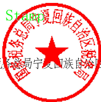
国家税务总局宁夏回族自治区税务局