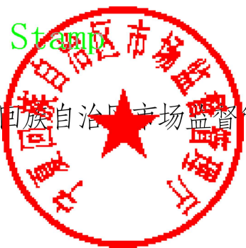
宁夏回族自治区市场监督管理局